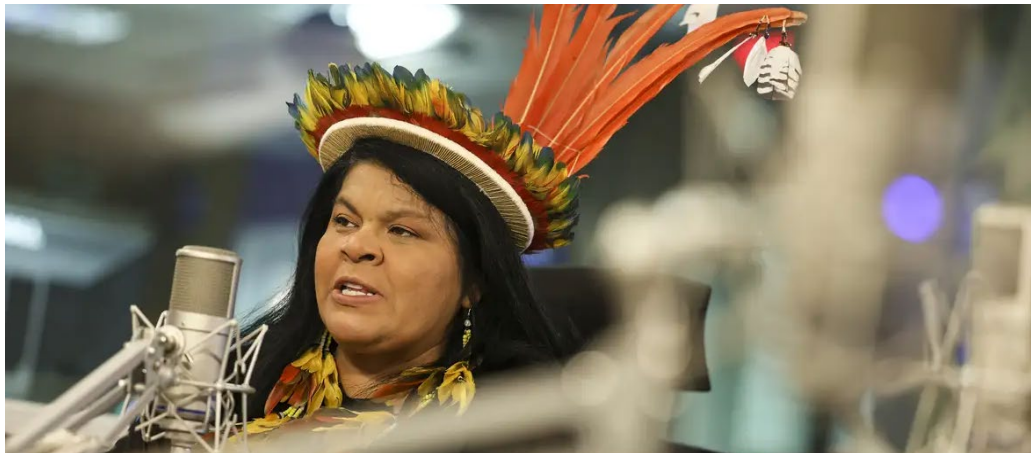
Sônia Guajajara al frente del nuevo Ministerio de los Pueblos Indígenas