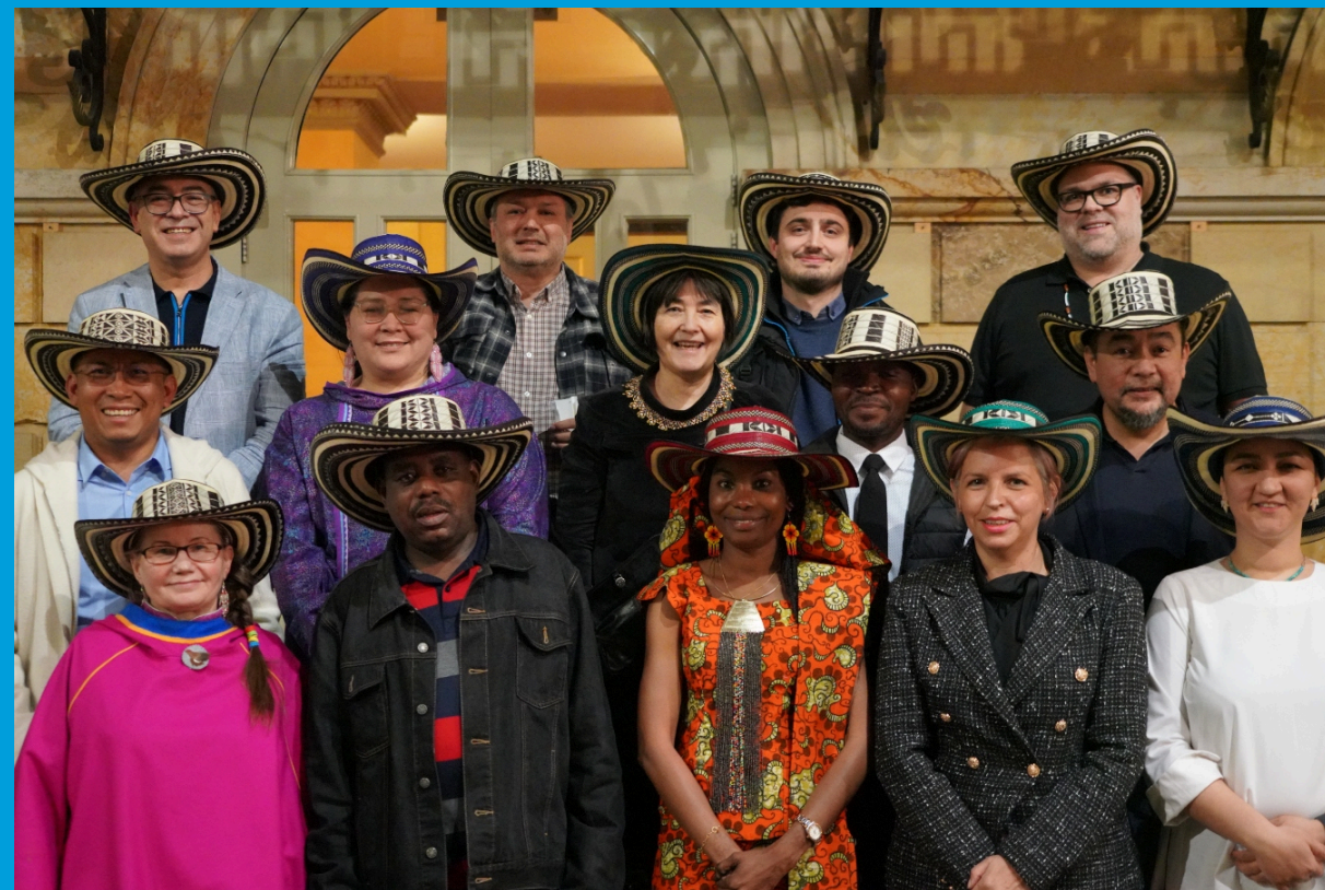
Los 16 miembros actuales del UNPFII