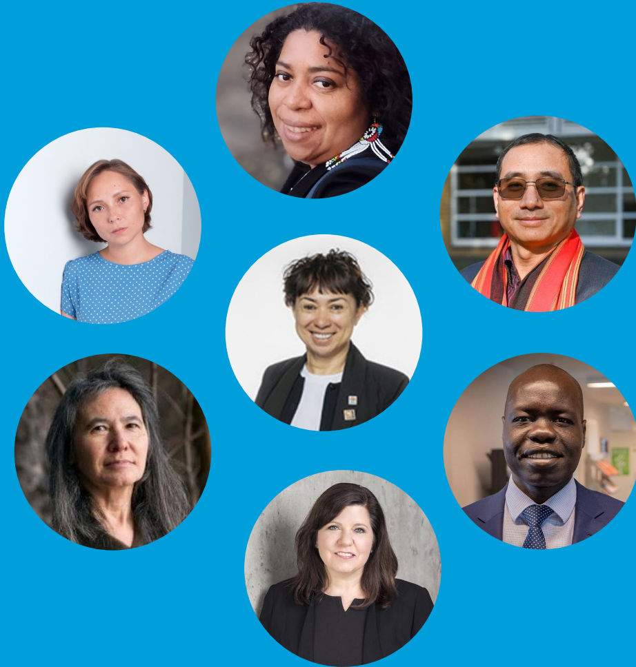
Expertos actuales Miembros 2024-2027